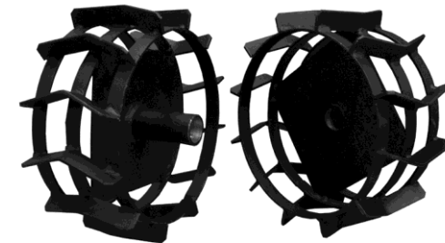
ГРУНТОЗАЦЕПЫ ШИРОКИЕ — АРТИКУЛ ДЛЯ ЗАКАЗА: C3001

Рязань (4912)46-61-64 Самара (846)206-03-16 Санкт-Петербург (812)309-46-40 Саратов (845)249-38-78 Смоленск (4812)29-41-54 Сочи (862)225-72-31 Ставрополь (8652)20-65-13 Тверь (4822)63-31-35 Томск (3822)98-41-53 Тула (4872)74-02-29 Тюмень (3452)66-21-18 Ульяновск (8422)24-23-59 Уфа (347)229-48-12 Челябинск (351)202-03-61 Череповец (8202)49-02-64 Ярославль (4852)69-52-93